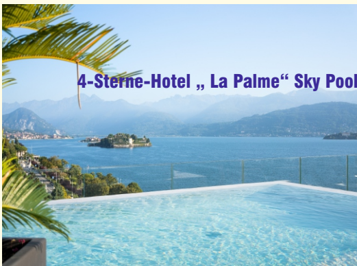
4-Sterne-Hotel „La Palme“ Sky Pool

Frühstück im Hotel. Heute unternehmen Sie einen Ausflug mit der Centovallibahn. Entlang des Lago Maggiore erreichen Sie Domodossola. Mit der berühmten Schmalspurbahn Vigezzina fahren Sie von Domodossola durch das italienische Valle Vigizzo und weiter durch die malerischen "hundert Täler" der Schweiz nach Locarno. Die Reise führt entlang tiefer Schluchten, vorbei an Wasserfällen, Weinbergen und Kastanienwäldern. Sie können unterwegs einen Halt im Wallfahrtsort Re machen. Abendessen und Übernachtung im 4-Sterne-Hotel „La Palme“.